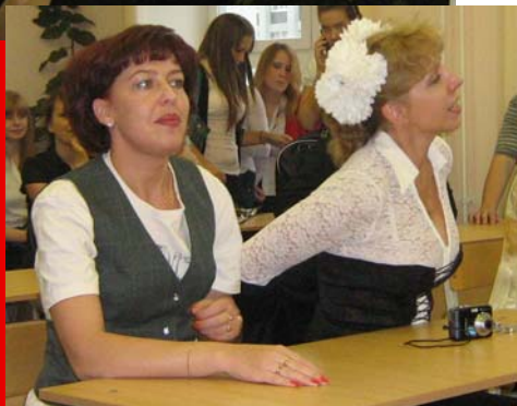
УЧЕНИЦЫ 12 «А» класса