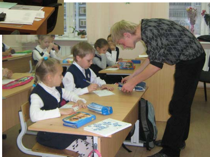
Учитель начальных классов...