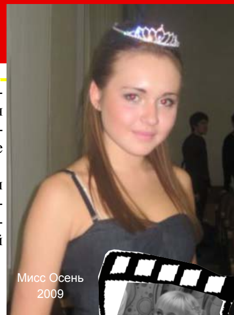
Мисс Осень 2009