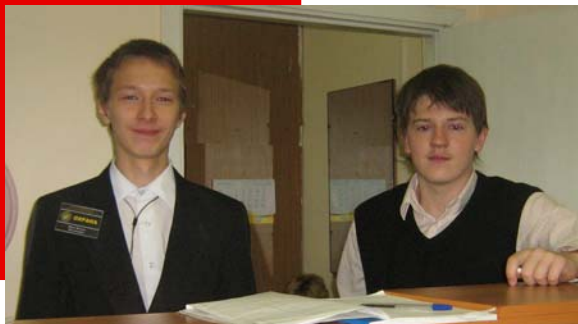
На посту спать нельзя!